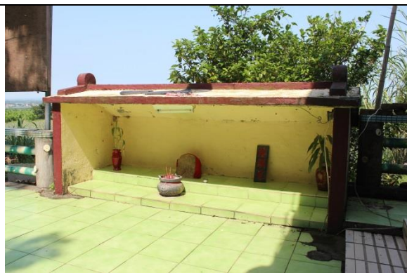
照片 2.3.8：溪頭兄即祈雨石

(十)溪頭兄：又稱祈雨石，加蚋埔平埔族人早期以狩獵遊耕為主，大部分生活的埔地亦容易缺水，故在乾旱時祈求天上掌管雨水的雨神能予普降甘霖，滋潤人畜萬物，故有祈雨活動。祈雨或在溪頭或在供奉雨王的家民宅庭院，故溪頭兄代表水源頭的神明（照片 2.3.8）。