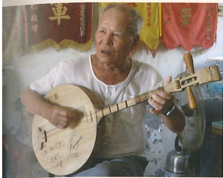
彈奏姿勢以左向斜抱方式，左手按弦，然後右手持撥片彈奏。