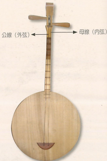
月琴除了用於歌謠或說唱等彈唱場合外，也會出現於北管樂、歌子戲、車鼓弄等表演。

以目前恆春半島流傳較為普遍的曲調而言，除了「平埔調」與「牛母伴」外，「思想起」、「四季春」、「五孔小調」等曲調皆會以月琴伴奏，不過這並不是絕對的表演形式，任何曲調的呈現，皆掌握在演唱者本身的詮釋，例如一般人演唱思想起時，通常是伴隨歌唱旋律的「隨腔