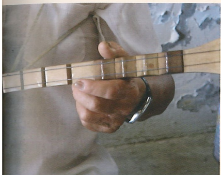
左手除了有穩定琴身的功能外，還兼具按弦取音、推拉琴弦的作用。