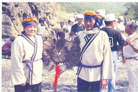
圖6-20：尪姨夫妻與雨王合影照。