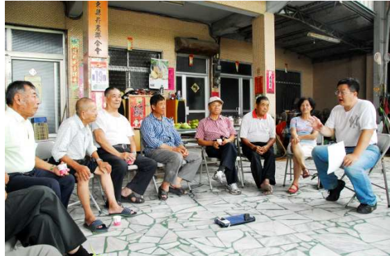
圖 2：屏東縣菸農聯合會訪談菸農的情景之二。