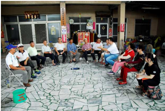
圖 1：屏東縣菸農聯合會訪談菸農的情景之一。