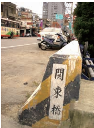
圖16：橫跨柯子湖溪連接新竹縣、市的橋梁稱為「關東橋」

說明：日治時期1908年興建之木橋，後改建為水泥橋，是橋名也是地名。關東橋曾為陸軍威武部隊新兵訓練中心的篤行營區所在地，以「淚灑關東橋」而聞名。如今地名仍在，篤行營區則於2011年11月17日交接予國科會，已變成新竹科學園區的一部分。（2000年攝）