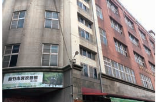
圖19：新竹市客家會館

新竹市政府於2005年設「客家事務委員會」，2011年成立「客家事務與原住民科」，復於2015年10月20日市務會議上正式通過組織編制調整案，將原有的客家事務與原住民科拆開獨立成為一個客家事務科隸屬於文化局，藉著組織架構重整，推動保護客家文化，統籌辦理客家語言和文化傳承。