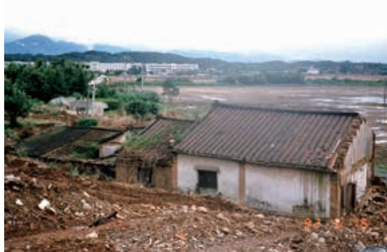
圖5：座落在金山面土地上的科學園區

說明：30幾年來金山面消失的老地名與客家聚落有：徐屋、胡屋、羅賴屋、出栗湖、上茶寮、下茶寮、隘路坪、泉興埔、坪埔頂、埔心、蜈蚣窩、風吹輦崎、三角、上庄、下庄、後背屋、厚力林等地，如今已被科學園區的工廠所覆蓋。（1993年攝）