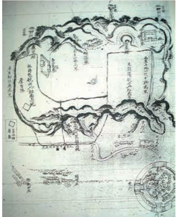
圖2：淡新檔案《竹塹城外金山面圖》

（2010）啟動的光埔與關新計畫，以慈雲路及關新路為主要發展線，再結合光復路商圈及臺鐵輕軌新莊站作為據點，現已成為一全新商業住宅區，關新里