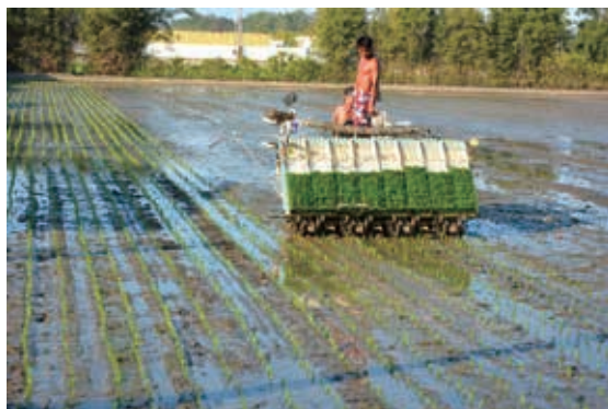
圖14：新竹海埔地（鹽埕埔）一角

歲月更迭，隨著苦苓腳、烏瓦窯聚落都市化，客人城逐漸沒落，海埔新生地也因第一代遷入的客家長者日漸凋零而荒蕪。民國90年（2001）座落在南寮的新竹市焚化爐投入運作，以及家畜屠宰場、餿水處理廠、高爾夫練習場、農舍的設立，更深深打擊了海埔新生地的農耕狀態。十七公里海岸線自行車道的開發，休閒觀光業興起，當地人文地景丕變，再加上近幾年耕作不符經濟效益，大部分土地休耕或填平待價而沽，客家人農耕生活也逐漸從這舞臺上退場。