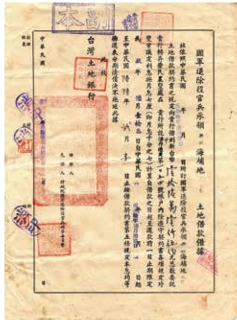
圖13：國軍退除役官兵承領新竹海埔地北區土地借款借據

說明：購買海埔新生地，1甲地13萬9千，當時只需繳付現金3萬9千，剩下的10萬元則分10年攤還。