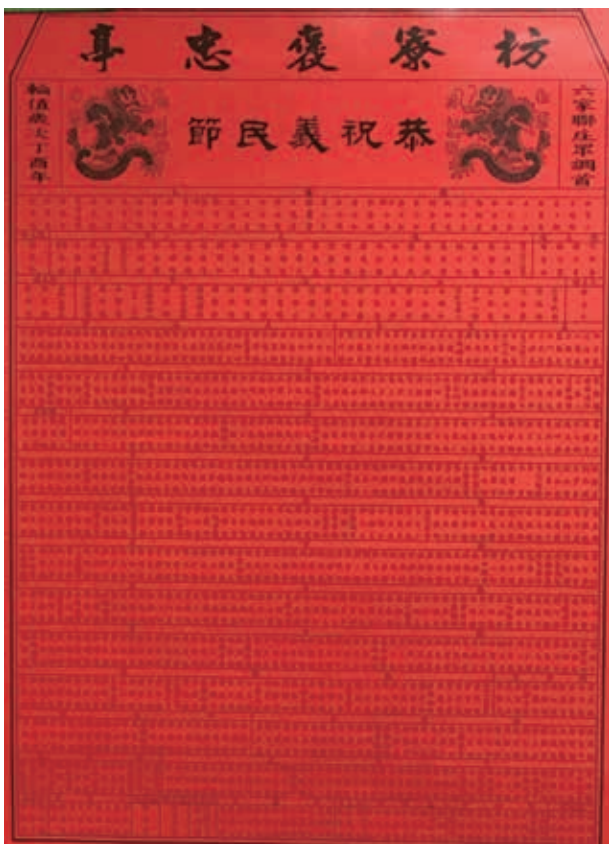
圖17：丁酉年（2017）義民廟六家聯庄衆調首名單

說明：值年的總爐主代表整個家族的公號，或某一個祖先的名字，換句話說，值年總爐主不是個人，而是一個家族。由於義民廟以宗族為輪值爐主，隨著宗族力量的壯大，義民廟也因之水漲船高。義民廟各輪值區總爐主是固定的，並不開放給所有庄民，輪值區總爐主用「自己的祭典、自己籌備」的競爭方式，成為全體庄民共同的榮耀。