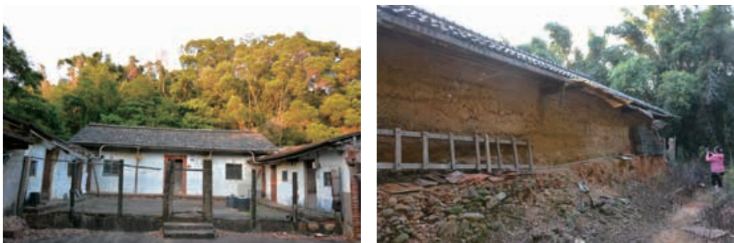
圖9、10：香山地區的傳統客家民居

說明：客家先民進入南隘、中隘、大湖、東香與茄苳等地開墾，首先要解決住的問題，他們就地取材興建泥牆屋（又稱牆頭屋、板築牆屋），係板築方式構築的泥牆，在固定的兩片木板中放入微濕泥巴混和禾稈與稻殼，以及縱橫交疊的竹片，再用大木槌夯實，一次製作一層（約3臺尺左右），做好之後再把木板剝開繼續做上一層，直到需要建築的高度為止。為了防止牆面受到風化或雨水侵蝕，表面會以白粉牆面作防潮的處理。早期興建泥牆屋係鄉親大家輪流換工起造的新屋，相當堅固耐用，超過百年的泥牆屋比比皆是！（2015年攝）