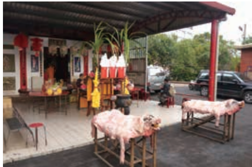
圖18：「復興慶壽嘗義勇忠公會」祭典一景

回溯竹塹城的發展史，林爽文事變與乙未戰爭跟客家人有關，卻沒有規劃相關的紀念公園。一座紀念公園可以記錄一個個城市故事，建構出一個有歷史感的城市價值。市府應在金山面地區設立「林爽文事變、乙未戰爭紀念公園」 46 ，讓市民認識客家族群捍衛土地與家園的堅韌精神，以及