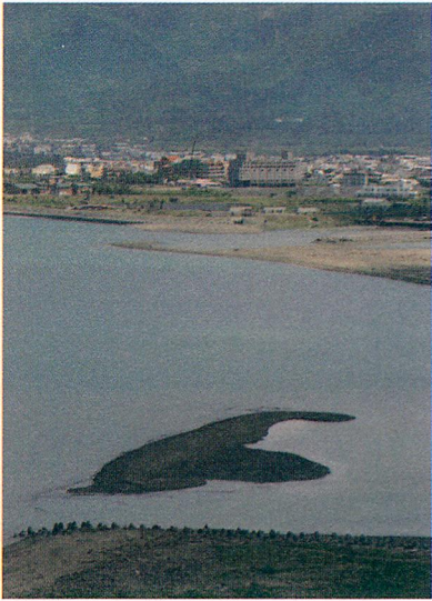
清代的「鳳山八景」中的「琅璫潮聲」，顯然琅璫不能離海太遠。

利的形勢。海灣也很寬闊，在東北季風期間，中式帆船可輕易進入。」（羅效德等 2013）「車城人發現他們的地理優勢，於是向大陸呼朋引伴，一時增加許多移民。」（Charles W. LeGendre 2012）「新來者帶來小型武器，那種武器原住民可能只有獲得少量的供應。還帶來大砲，這是原住民沒有的。在英勇的抵抗後，土著被驅趕到山丘去。漢人就佔據了那平坦的鄉土……。」