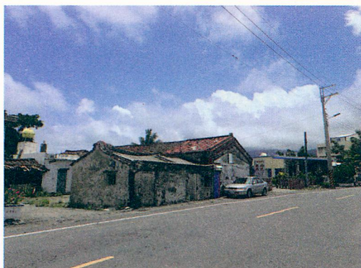
清代的「琅璦地方」，最熱鬧的地方是現今的車城。

腳東南方約五英里處是楓港」（羅效德等 2013），荊桐腳也就是今位於枋山鄉境內，枋山溪左岸，至今仍稱為荊桐的小聚落。