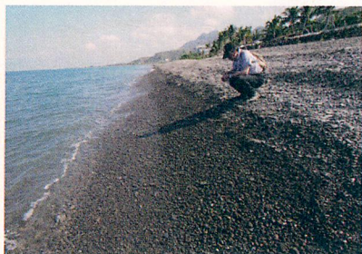
通往「琅璫地方」，主要的道路就是海岸線。